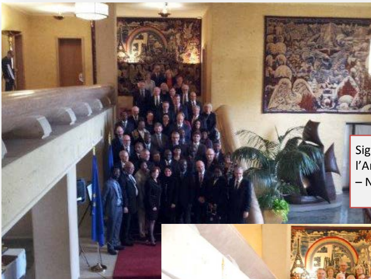
Signature des Statuts à l'Ambassade de France à Ottawa – Novembre 2014