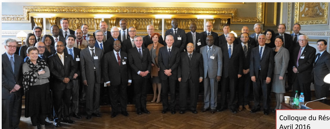
Colloque du Réseau à Paris – Avril 2016

Conseil de la magistrature de l'Équateur Conseil supérieur de la justice de la Belgique L'Organisation internationale de la francophonie