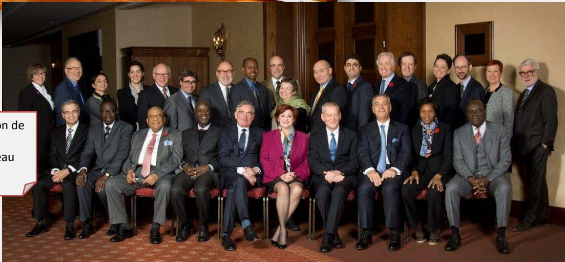
Cérémonie à l'occasion de la signature de la Déclaration de Gatineau Novembre 2014