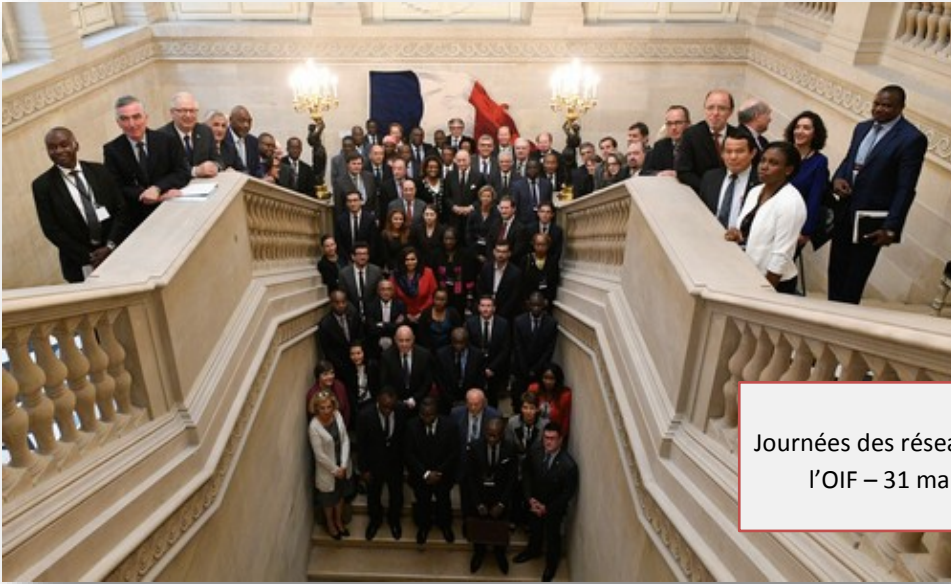
Journées des réseaux institutionnels de l'OIF – 31 mai et 1 er juin 2016