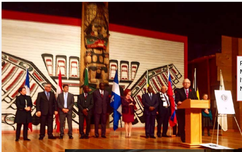
Présentation du Réseau au Musée canadien de l'histoire de Gatineau Novembre 2014