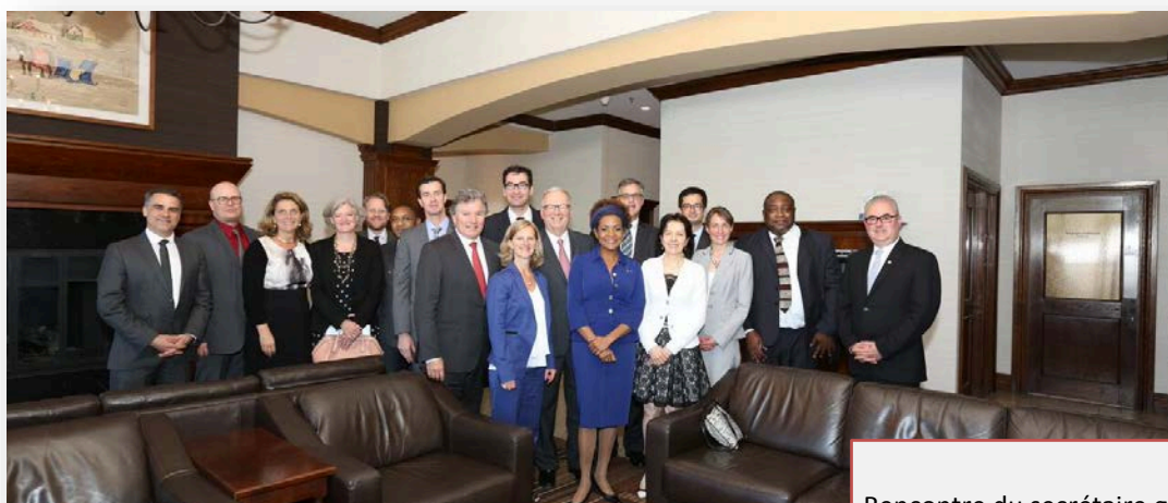
Rencontre du secrétaire général avec madame Michaëlle Jean – juin 2015

Depuis sa création, le Bureau (comité exécutif) s'est réuni à deux reprises, en février 2015 et en avril 2016. Plusieurs rencontres ont également été tenues afin d'informer différents acteurs du mandat du nouveau Réseau. Ces activités se sont déroulées autant auprès de conseils supérieurs de la magistrature que d'acteurs politiques. De plus, des rencontres ont eu lieu avec des représentants d'autres réseaux institutionnels, dont l'une, en juin 2015, en présence de la Secrétaire générale de l'OIF, madame Michaëlle Jean .